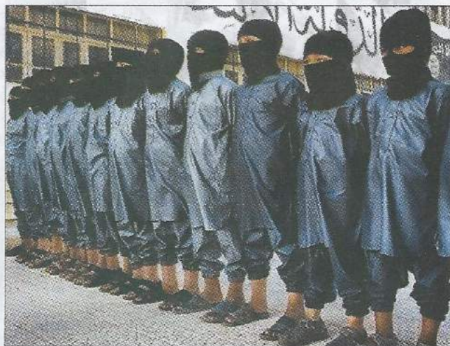
Руководство ИГ через специальные пункты по набору несовершеннолетних активно вовлекает детей в ряды боевиков и смертников

Военно-техническая, материальная и финансовая поддержка ИГ осуществляется за счет