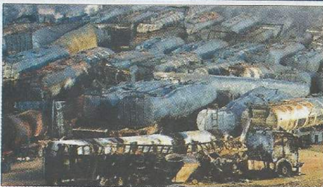
Действия Воздушно-космических сил России в 2015–2016 годах заметно ослабили военный и экономический потенциал террористической группировки «Исламское государство» и способствовали освобождению значительного числа населенных пунктов в Сирии