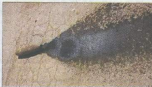
Директор ЦРУ США Джон Бреннан заявил, что боевики ИГ применяли во время боевых действий в Ираке и Сирии химическое оружие. Факты применения боевиками ИГ боеприпасов с отравляющими химическими веществами были обнаружены в г. Марea (Сирия, провинция Алеппо)