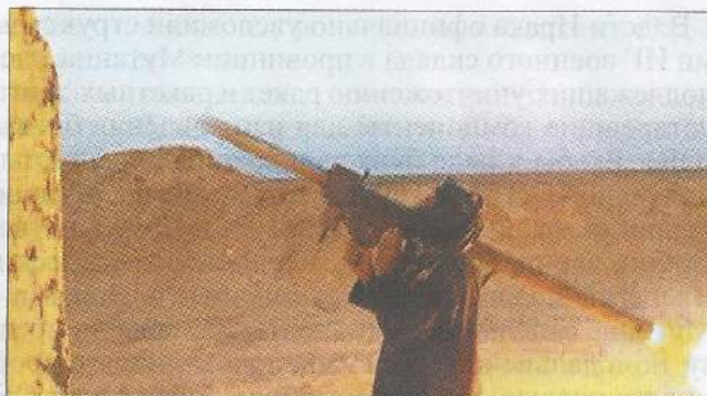
По сообщениям германской газеты «Бильд», в руки боевиков ИГ попали захваченные в Сирии и Ираке переносные зенитные ракетные комплексы, с помощью которых они могут сбивать пассажирские самолеты при взлете и посадке

По утверждению министра иностранных дел Австралии Джулии Бишоп, ИГ прилагает усилия к созданию и химического оружия (ХО). По ее словам, «применение ИГ хлорина, вербовка группировкой высококвалифицированных и подготовленных профессионалов, в том числе из стран Запада, указыва-