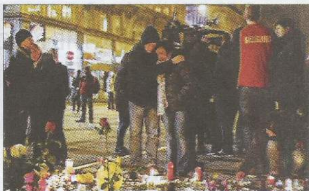
Масштабные теракты во Франции, Турции и Бельгии продемонстрировали, что ни одно государство не может чувствовать себя в безопасности, пока существуют в мире агрессивные анклавы террористов, подобные «Исламскому халифату»

Радикальный ислам сродни фашизму. Вероломно захватив территории ряда стран, его сторонники совершают масштабные преступления против человечества и угрожают экспансией террора по всему миру. Эффективность противодействия этому явлению во многом зависит от готовности Вашингтона, а также его западных и региональных союзников тесно взаимодействовать в борьбе против ИГ с Российской Федерацией, Китаем, Ираном и другими странами, которые проводят отличную от США внешнюю политику на Ближнем Востоке, но готовы сообща бороться с международным злом. Успеху в деле противодействия исламистской группировке могли бы способствовать жесткие ограничительные санкции Совета Безопасности ООН в отношении выявленных спонсоров терроризма — Турции, Саудовской Аравии и Катара. 🌐