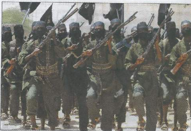
Военно-техническая поддержка ИГ осуществляется за счет внешних источников (спецслужбы и неправительственные исламистские организации, различные исламистские фонды стран Персидского залива, Турции и других стран), а также путем собственной военной и хозяйственно-экономической деятельности

В изъятом у террористов компьютере был найден доклад о преобразовании бубонной чумы в оружие массового поражения (ОМП). По мнению боевиков, преимущества биологического оружия – его низкая стоимость и высокая скорость распространения. В докладе исследуются разнообразные методы и способы применения химического или биологического оружия на больших площадях. По мнению зарубежных экспертов, возможность