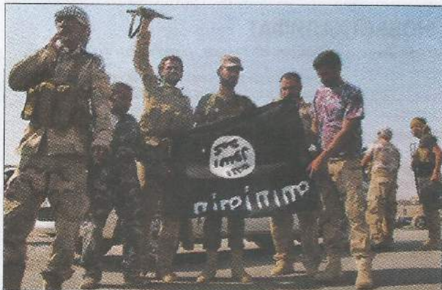
По оценкам ООН, в рядах ИГ и других террористических группировок на Ближнем Востоке воюют свыше 35 тыс. добровольцев и наемников из 100 стран мира

Действия Воздушно-космических сил (ВКС) России и ВВС международной антитеррористической коалиции под эгидой США в 2015–2016 годах заметно ослабили военный и экономический потенциал «Исламского государства» и способствовали освобождению ряда населенных пунктов в Сирии и Ираке, но говорить о коренном переломе в борьбе с исламистами пока преждевременно. Зарубежные эксперты